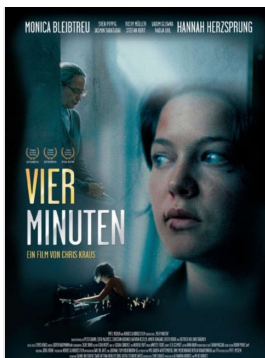
Vier Minuten 2005-2006 Filmtone Meister