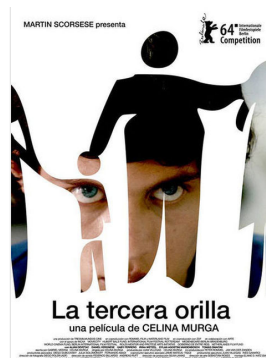
Das dritte Ufer... 2012-2014 Filmtone Meister