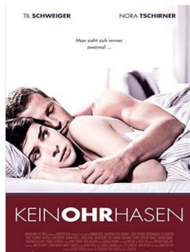
Keinohrhasen 2007 Filmtone Meister