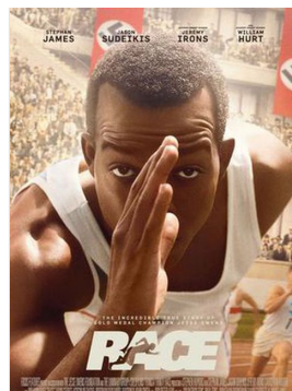
Zeit für Legenden 2014-2016 Filmtone Meister